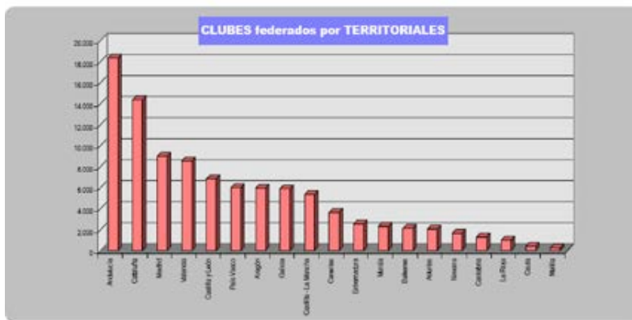
Fig. 2. Número de clubes federados por territorios