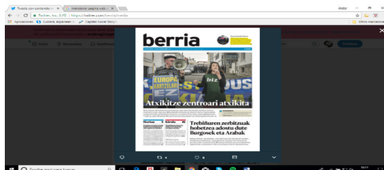
Figura 1: Ikusketa hemerografikoko adibidea.

Berria, Diario Vasco eta El Correoren azaletako gaitegiek osatzen dute azterketako bigarren atala. Portadak @berria, @elcorreo_com eta @diariovasco-ren Twitter kontuetako argitalpenetatik lortu dira. Irudian edozein portada bereganatzeko sistema: