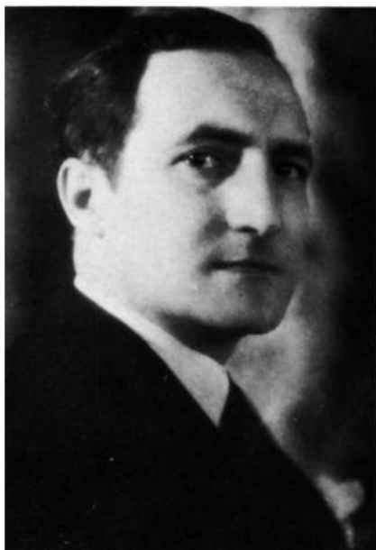
José Antonio de Aguirre y Lecube.