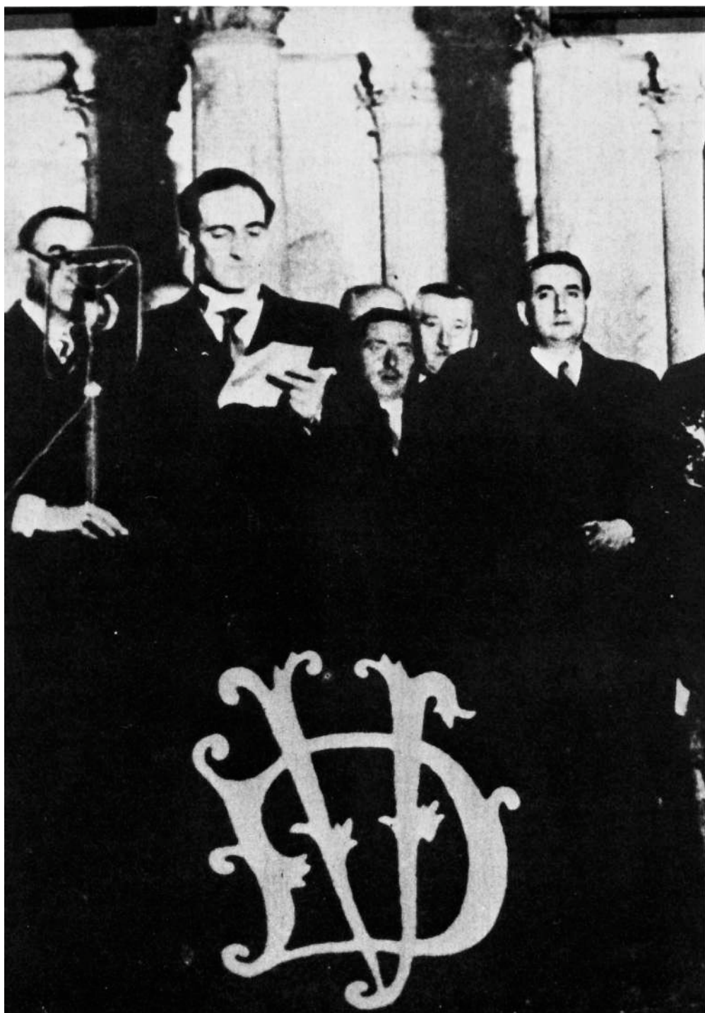
José Antonio Aguirre jura su cargo como presidente de Euskadi. Guernica. 7 Octubre 1936.