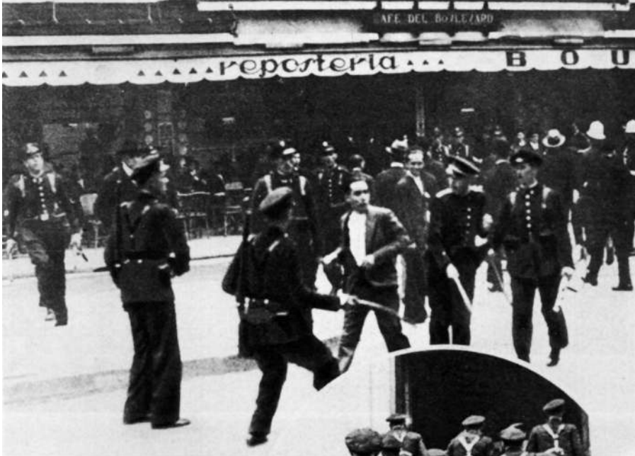
Incidentes en Bilbao el día de las elecciones a Comisiones Gestoras. 12 Agosto 1934.