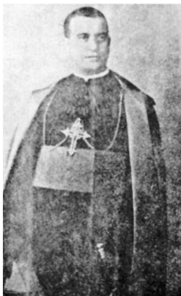
Mons. Leopoldo Eijo y Garay.