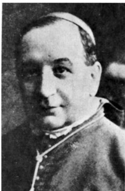
Mons. Prudencio Melo y Alcalde.