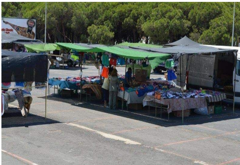
Figura 1 Mercadillo en San Vicente de la Barquera, 2017

Para descubrir esta conexión antropológico-económica no hemos tenido otra alternativa que recorrer los principales pasos, con una orientación especial y un punto de mira puesto en el comercio. Como se ha justificado, nuestro interés y objeto de estudio se centra en un ámbito cultural marcado por aquél (venta pañera y comercial textil). Sin embargo, más allá de lo que fue un constante debate en el seno de la antropología entre formalistas y substantivistas, al que se sumarían también los marxistas, cada orientación aporta puntos de confluencia con los que detectar y comprender aspectos fundamentales de la economía pañera. Cada una de estas opciones, trató de aportar conocimiento científico, abriendo una vía que podemos indicar como general en torno a los comportamientos y formalismos económicos, el papel y las bases de tipo institucional y las relaciones sociales en definitiva que comportan la acción económica.