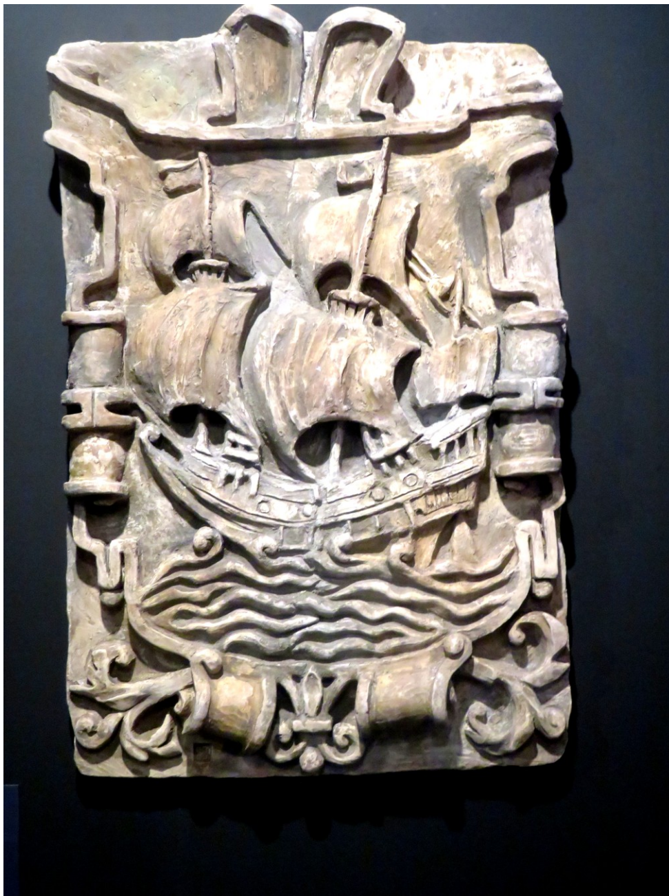
Figura 8 Reproducción en gres de un escudo procedente del edificio del Consulado, actualmente conservado en la casa consistorial de Bilbao (J. M. Uribarren, 1974)

En lo que se refiere a su ubicación el Consulado de Bilbao tuvo su sede en una casa adosada a la iglesia de San Antón (Figura 6). La última construcción del siglo XVII, acogía también el Ayuntamiento de la villa. El edificio fue demolido en 1896. Afortunadamente se pudo salvar una parte del mobiliario del viejo Consulado, finalmente salvaguardada como vamos mostrando, finalmente en Itsasmueum Bilbao .