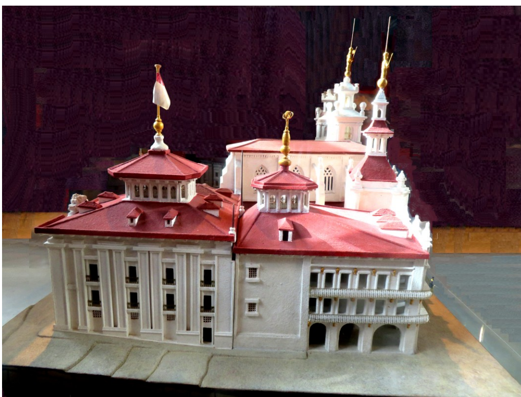
Figura 7 Iglesia de San Antón, Ayuntamiento de Bilbao y Consulado (a partir de maqueta de Jaime Laita, 2000)