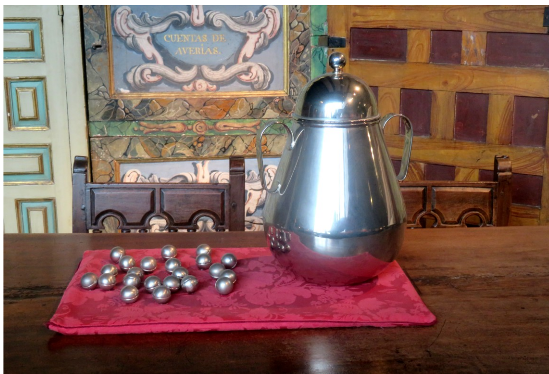
Figura 5 Bolas y urna de votaciones

Ordenanzas de la Ilustre Universidad y Casa de Contratación de la M. N. y M. I. Villa de Bilbao, insertos sus Reales Privilegios, aprobados y confirmados por el Rey Nuestro Señor Don Felipe Quinto (que Dios guarde) Año de 1737. Reimpresas con superior permiso. Madrid, en la Imprenta de Sancha. Año de 1796. A costa de la misma Universidad, y Casa de Contratación