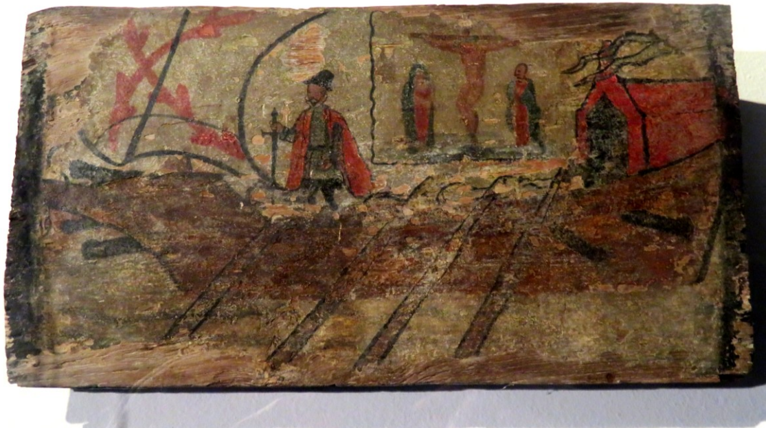
Figura 12 Uno de los casetones del Palacio de Arana en el que aparece la Falúa del Consulado (temple sobre tabla, s. XVI)