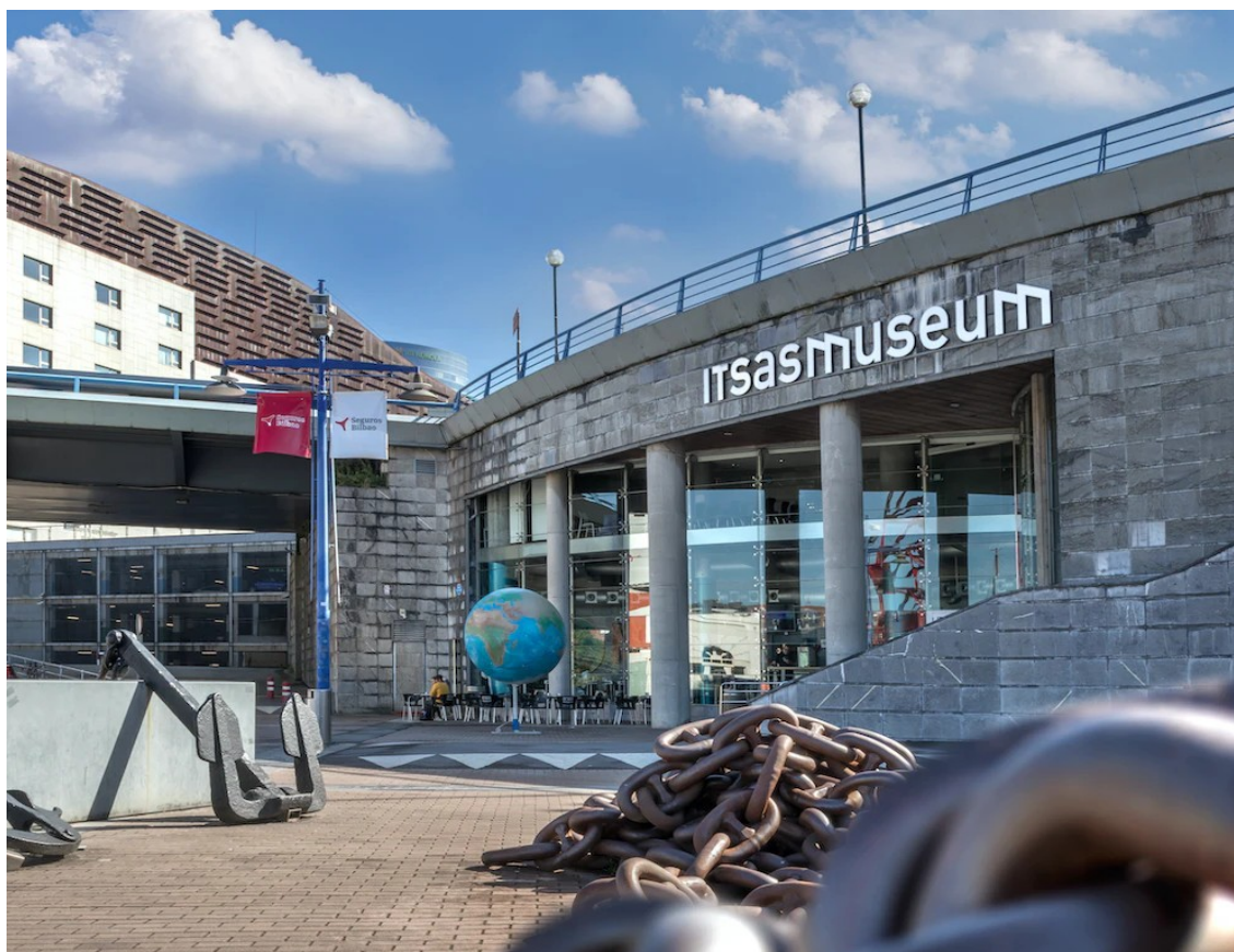
Figura 13 Itsasmuseum Bilbao