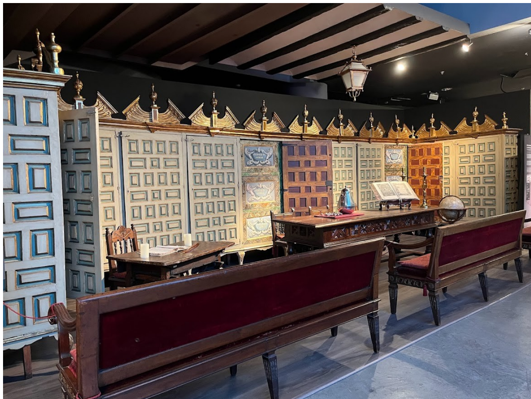
Figura 2 Armarios procedentes del Consulado (1761)

Durante los tres siglos siguientes el Consulado sería la institución encargada de regular la actividad comercial y portuaria de Bilbao y la Ría, con jurisdicción sobre la misma y con su propia normativa recogida en sus Ordenanzas. Tenía autoridad para regular, legislar y gestionar sus propios asuntos, además de traficar y formar flotas comerciales. Así mismo actuaba como Tribunal Judicial de Comercio interviniendo en la resolución de los pleitos de los mercaderes de la Villa y de aquellos que tenían tratos en Bilbao.