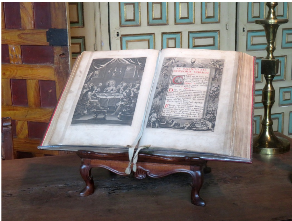
Figura 6 Misal romano (1760) sobre atril, pertenecientes al Consulado de Bilbao