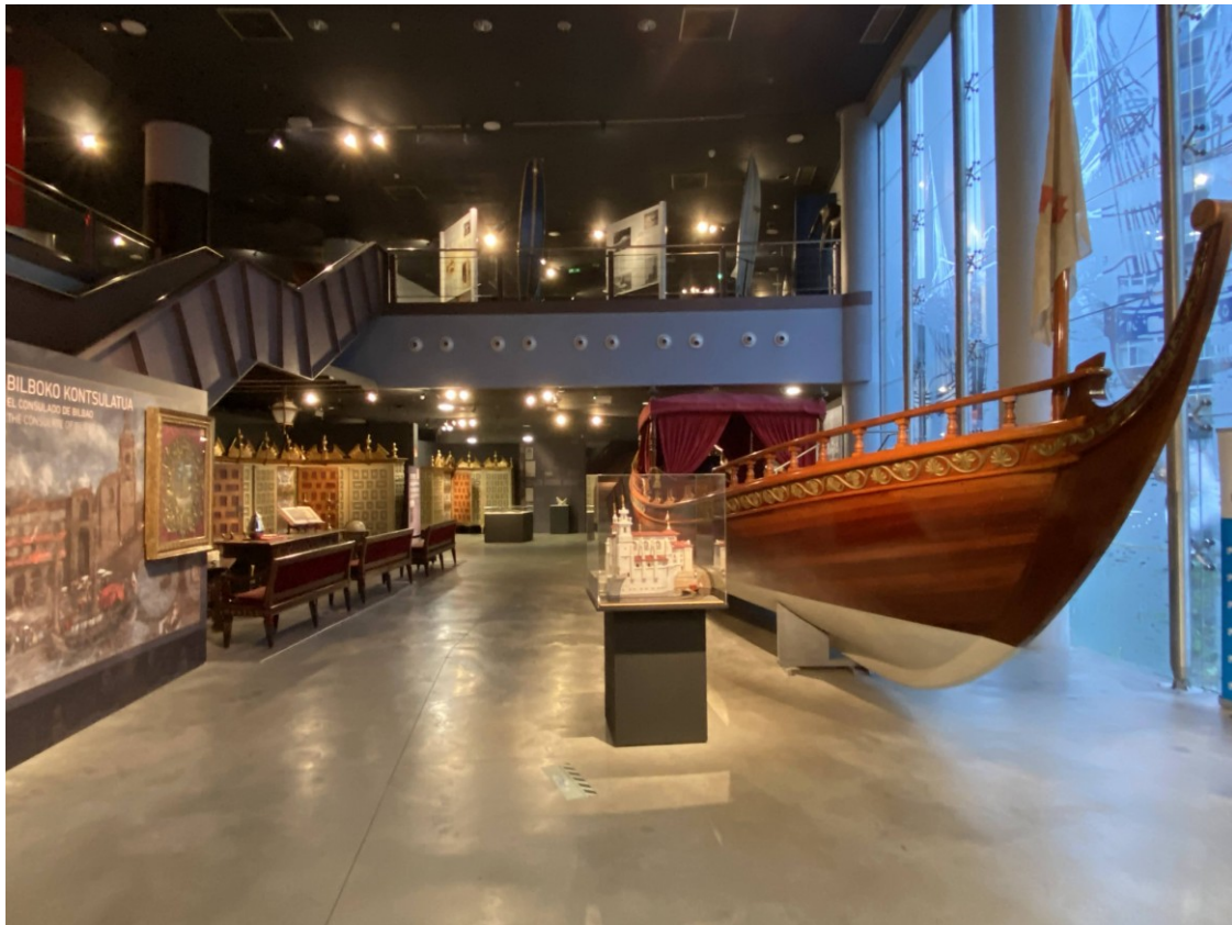
Figura 1 Vista de la sala Consulado de Bilbao - Bilboko Kontsulatua A la derecha la falúa del Consulado

La muestra –integrada en el recorrido de la exposición permanente del museo marítimo– remarca el momento de la creación de esta significativa institución la cual tuvo lugar el 22 de junio de 1511, mediante carta de privilegio otorgada por la reina Juana de Castilla. A partir de ese momento quedaría reconocida bajo la denominación de Consulado, Casa de Contratación, Juzgado de los Hombres de Negocios de Mar y Tierra y Universidad de Bilbao .