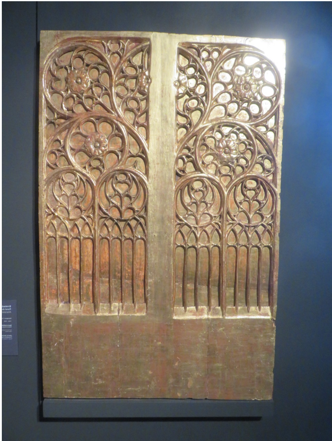
Figura 10 Panel de retablo anónimo (1520-1530) Realizado en madera tallada y dorada (120 x 79 cm) Procedencia: Capilla del Consulado en la iglesia de San Antón