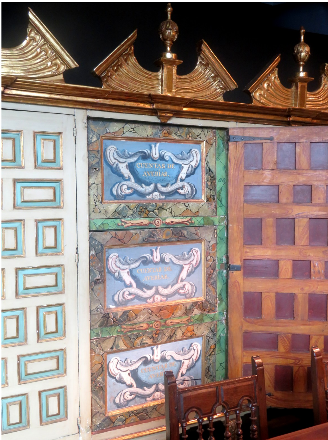
Figura 3 Puerta interior sobre la que se puede leer "Cuentas de Averías"

A continuación, además de las figuras ilustrativas ya mostradas, ofrecemos otra serie conteniendo algunos de los elementos que componen la exposición, cada uno de los cuales responde a las principales funciones desempeñadas por la institución. Entre estas encontramos la propia gestión y funciones del Consulado (Ordenanzas), su funcionamiento interno, y otras referentes al ámbito propiamente simbólico.