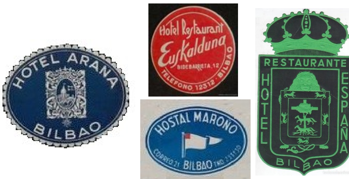
Figura 3 "Pegatinas" o distintivos de antiguos hoteles ubicados en el Casco Viejo-Zazpi Kaleak de Bilbao 19

Por otro lado, el turista tendrá la oportunidad de conocer 'el chiquiteo', objeto de patrimonialización y señalamiento material en una esquina, en la que convergen la calle Santa María, calle del Perro y calle de la Pelota. Es una información consumible sobre la marcha, bajo la batuta de los y las guías turísticas quienes advierten tanto de la costumbre como de la peculiaridad del lugar donde se recoge. Se trata de un punto metafóricamente milagroso desde el que al dirigir la mirada hacia el este, se divisa la Basílica de Begoña, virgen tradicionalmente venerada y luego patrona de Bizkaia desde 1738 18 , así como de los 'chiquiteros expresamente hoy en día. Basílica que con el desarrollo urbanístico dejará de ser visible, tapada por la altura de numerosas nuevas edificaciones levantadas en la ciudad.