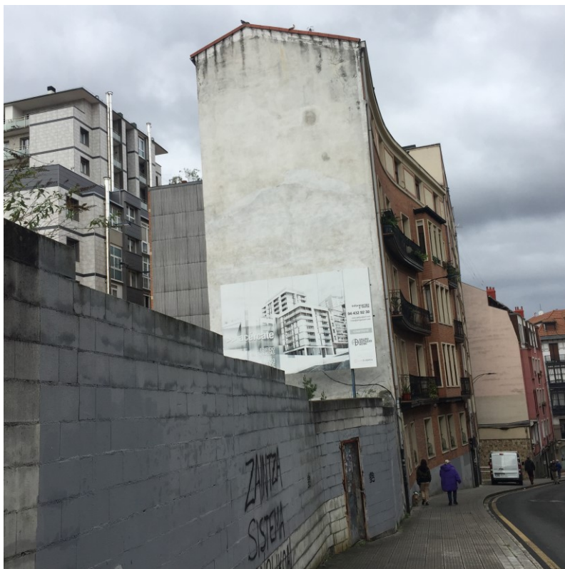
Figura 12 Muro construido, correspondiente a posteriores intervenciones urbanísticas (calle Zabalbide, 2022)