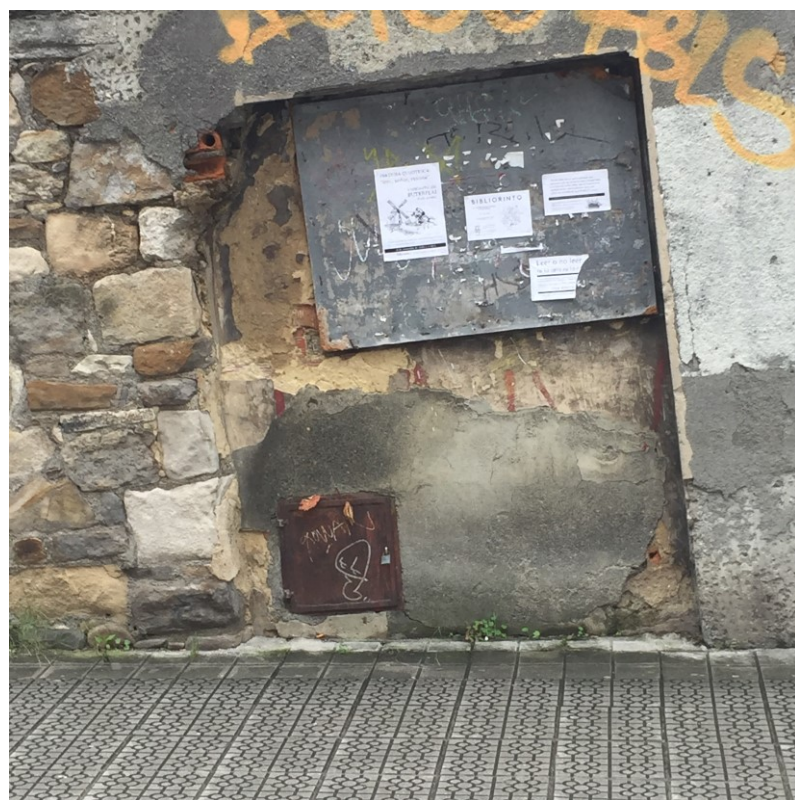
Figura 16 Puerta, refuncionalizada como soporte de anuncios locales (2023)