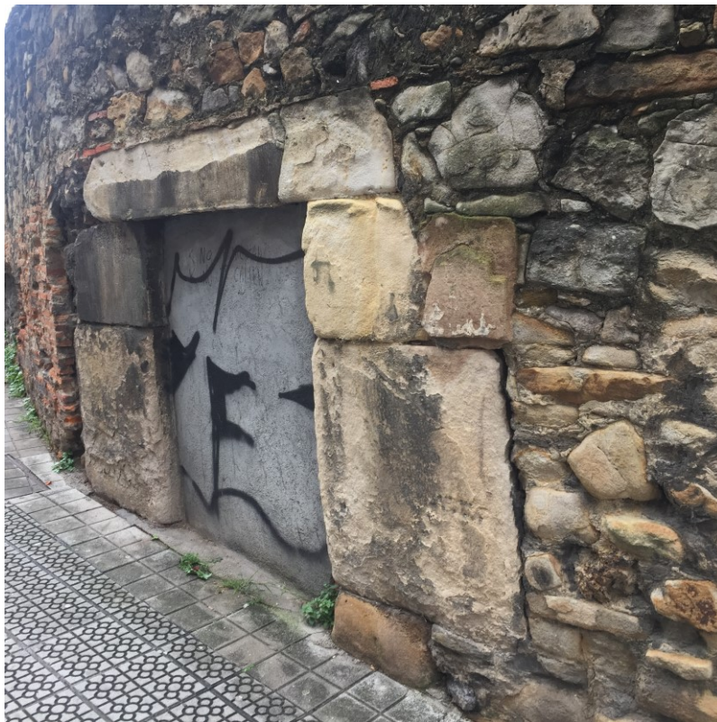
Figura 15 Puerta del muro, tapiada y grafitada (calle Zabalbide, 2023)