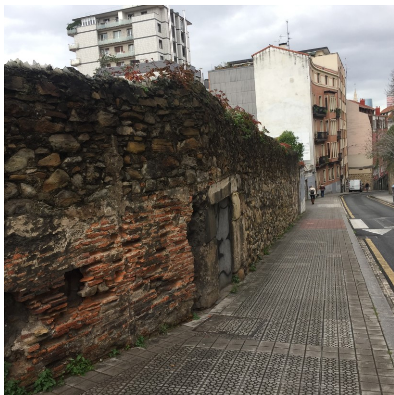
Figura 13 Viejo muro de piedra con retazos de ladrillo (calle Zabalbide, 2022)