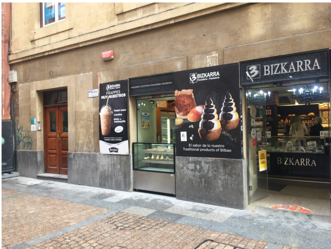
Figura 7 Panadería-Pastelería Bizkarra, punto significativo, frecuentado por las visitas guiadas (Calle de la Cruz) (2022)

se ciñe a explicaciones históricas y anecdótico-cotidianas, cuya fuerza local y carácter exclusivo se tratan de poner en valor.