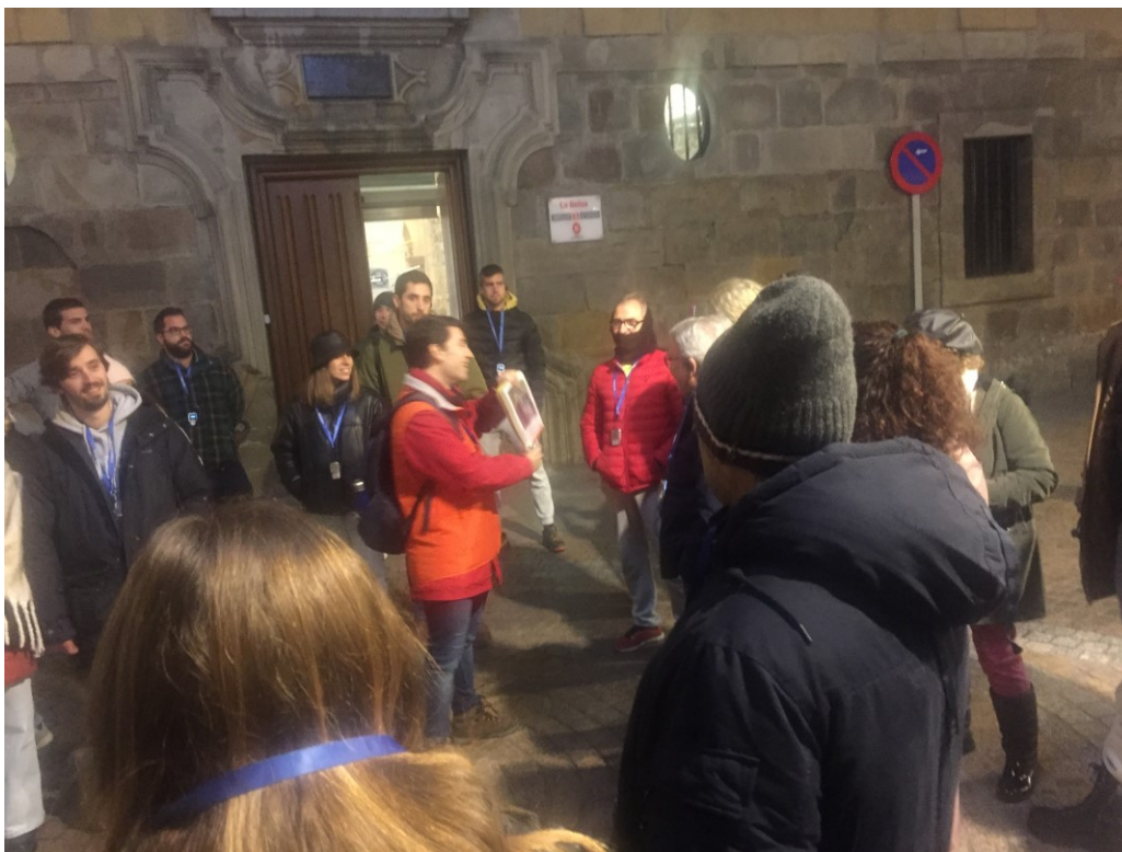
Figura 5 Visita guiada (calle Santa María, 2023)

Hay dos lugares que llaman la atención por su referencia anecdótica. Al primero de ellos hemos hecho referencia un poco más arriba, punto exclusivo desde el que se podía apreciar la iglesia de Begoña. Desplazamiento visual entre dos lugares, el Casco Viejo y Begoña, pero también 'conexión imaginada' con un espacio sagrado, con la Virgen protectora y patrona, por cuya mediación el consumo de alcohol queda simbólicamente justificado, permitido e integrado en el contexto cultural. En esta óptica de tipo simbólico, todos los años en este punto –el 11 de octubre, fecha canónica de la Virgen– 'chiquiteros' y otras personas le rinden homenaje. Es la Fiesta del Txikitero (organizada por el colectivo Txikiteroen Artean ), en la que destaca un pequeño ritual callejero, con el que se reafirma y trata de perpetuar el 'chiquiteo', como hemos señalado prácticamente desaparecido en su modelo tradicional. Los símbolos centrales del ritual se ciñen a una ofrenda floral y al rezo de la Salve ante la hornacina de la Virgen, ubicada enfrente, en el Edificio de La Bolsa (antigua ferretería, hoy locales municipales). En 2019 tenía lugar la 56ª celebración. Como vemos, este punto del lugar se muestra con una importante carga simbólica y aunque los turistas realmente quedan al margen, por medio de las visitas guiadas se insiste en narrarles y darles a conocer estos aspectos ligados al lugar.