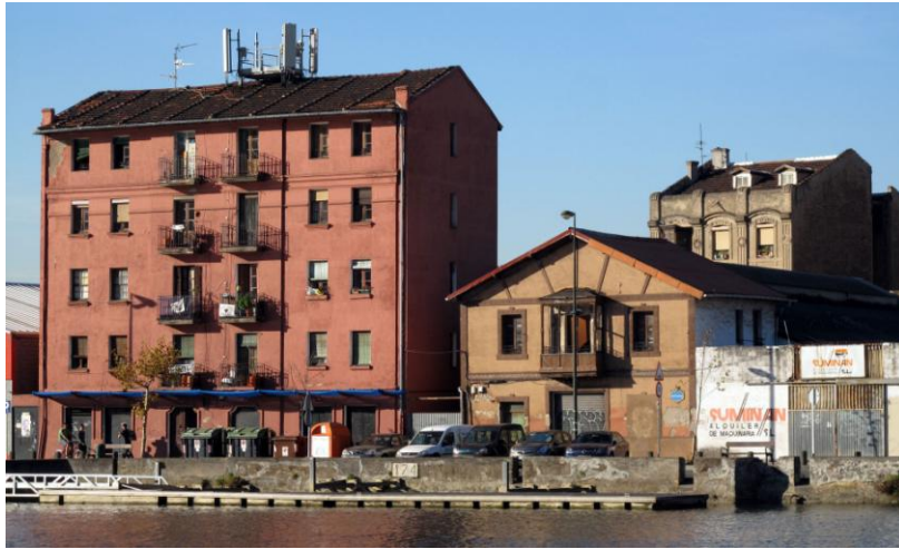
Figura 7. Ejemplo de diversos estilos arquitectónicos de vivienda en el frente de La Ría

otras áreas de oportunidad mucho más valorizadas para la proyección de Bilbao como ciudad global(izada). Lo cual se ha complementado con las elucubraciones quizás excesivamente especulativas y 'vaporosas' realizadas por Bilbao Metrópoli-30 acerca de Zorrotzaurre. Entidad de supuesta colaboración multidisciplinar (institucional-administrativa, empresarial, académica, ciudadana, etc.) que rige y lidera las 'narrativas sobre la ciudad' en Bilbao. Con la concepción de la ciudad como nueva 'región metropolitana' europea integrada en el Arco Atlántico e inspirada por los valores referenciados en el acrónimo IPICA: Innovación, Profesionalidad, Identidad, Comunidad y Apertura, imaginó sobre el espacio de Zorrotzaurre el 'distrito tecnológico' INNOVAREA para la atracción empresarial puntera, parques tecnológicos, universidades extranjeras, etc. Ante ello podríamos subrayar que aún perdura cierto temor de fomento de la participación ciudadana ante el relativo fracaso de empeños como la Mesa de Rehabilitación de Bilbao La Vieja, los enfrentamientos entre coordinadora y poder municipal así como la permanencia de la 'frontera mental' excluyente y segregadora entre la Ría y el Canal.