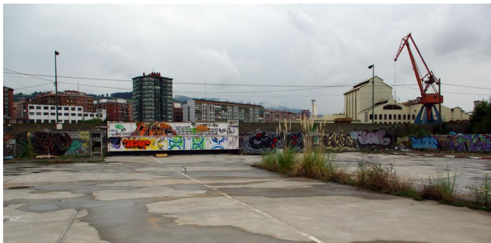
Figura 1. Área de Zorrotzaurre con espacios interiores vacíos tras la retirada industrial 1

“En un período caracterizado por la preeminencia de la lógica economicista frente a la urbanística, la ría va introduciendo una poderosa lógica diferenciadora en la densa malla de núcleos interrelacionados, jerarquizados y especializados funcionalmente, con Bilbao en la cúspide del rango urbano, que van a conformar el área metropolitana. Este espacio fue creciendo de un modo desordenado, acomodándose a las necesidades del desarrollo industrial, donde la vida social se establecía en torno al mundo laboral” (P. Campelo, et al. , 2011: 76).