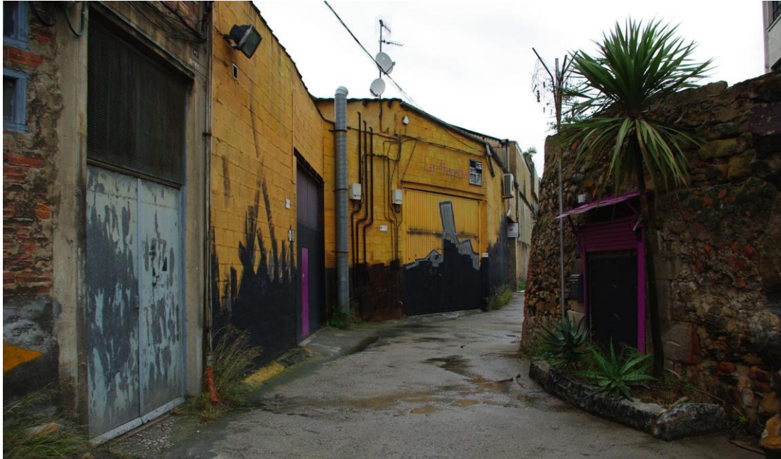
Figura 9 Pabellones reutilizados para actividades artístico-culturales e 'industrias creativas'