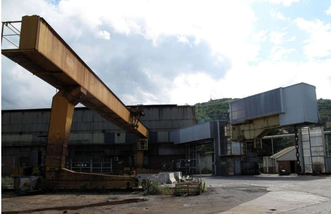
Figura 16 Interiores en desmontaje de la fábrica "Vicinay Cadenas" durante la primavera del año 2016