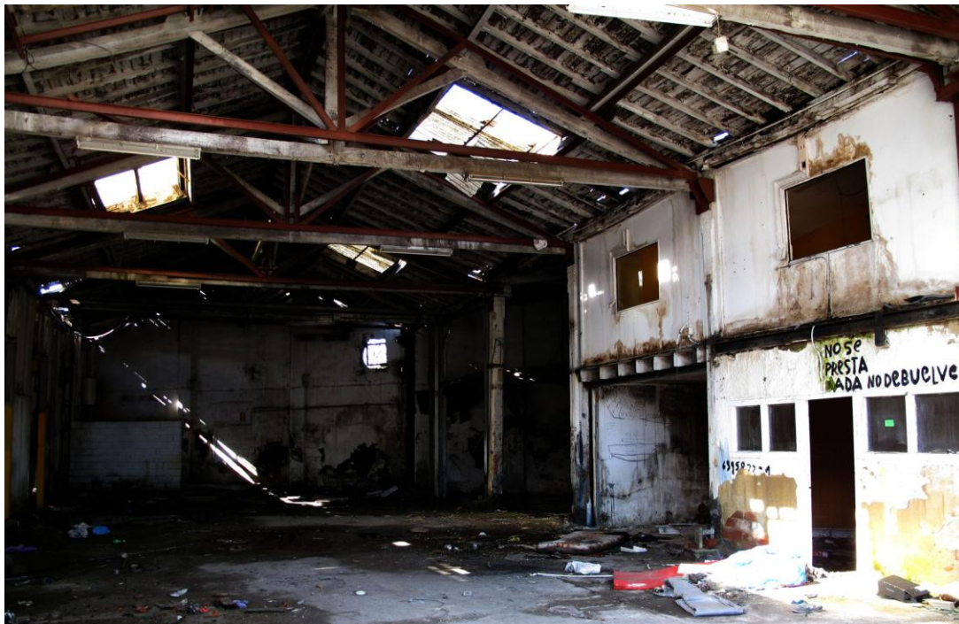
Figura 17 Oscuros pabellones industriales en fase de vaciamiento interior, aunque a veces habitados (primavera 2018)