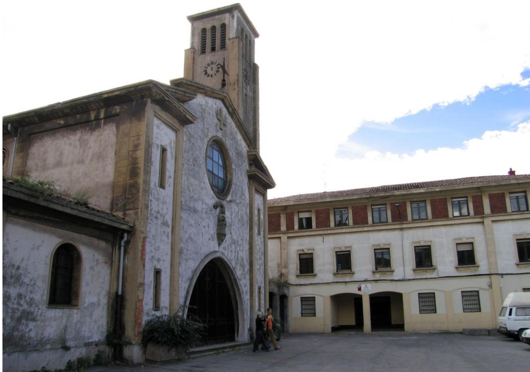
Figura 10 Resquicios urbanos recuperados, que corresponden básicamente a los espacios públicos históricos más notables de la Ribera de Deusto. Iglesia de San Pablo que preside la pequeña plaza multiuso