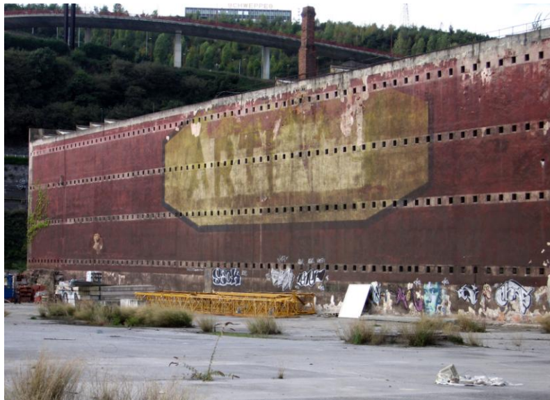
Figura 8. Hitos fabriles del enclave en desmantelamiento (fábrica "Artiach, Duquesa María")