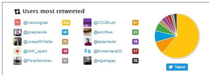
Figura 8. Usuarios más retuiteados por la directora de Nació Digital , Karma Peiró