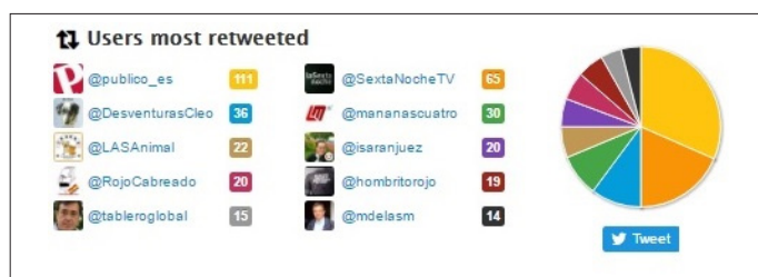
Figura 2. Usuarios más retuiteados por la directora de Público , Ana Pardo de Vera

La directora del diario digital Público es la más activa en Twitter del total de directivos investigados, como se desprende de la anterior tabla comparativa. Para saber el tipo de uso de la red de microblogging por parte de la periodista, se analizan los diez usuarios que más retuiteó y los diez que más mencionó en el periodo de tiempo analizado.