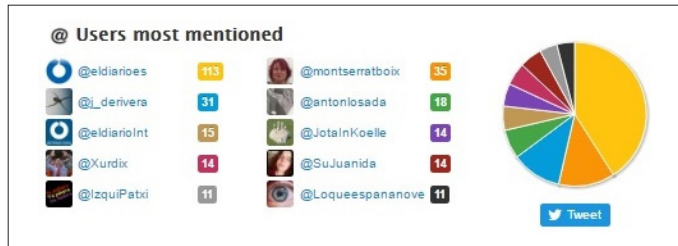
Figura 7. Usuarios más mencionados por el director de Eldiario.es , Ignacio Escolar

En consecuencia, de las diez cuentas más retuiteadas por Ignacio Escolar, ocho están relacionadas con Eldiario.es , por ser propias del medio o por corresponderse con periodistas o colaboradores.