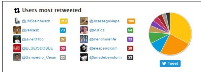
Figura 4. Usuarios más retuiteados por el director de El Español , Pedro J. Ramírez