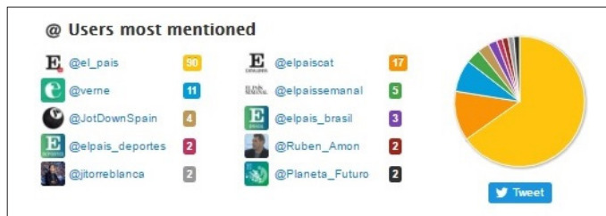
Figura 13. Usuarios más mencionados por el director de El País , Antonio Caño

En consecuencia, las diez cuentas más retuiteadas por el director de El País , Antonio Caño, están relacionadas con el diario, bien por ser cuentas del propio medio o por tratarse de los perfiles de algunos de sus periodistas y colaboradores.