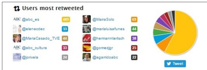
Figura 14. Usuarios más retuiteados por el director de ABC , Bieito Rubido

El director de ABC , Bieito Rubido, es poco activo en Twitter, como demuestra el hecho de que es preciso volver la vista atrás hasta julio de 2014 para poder sumar los 3.200 tuits necesarios para el análisis por parte de la herramienta Twitonomy.