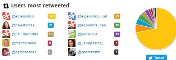
Figura 18. Usuarios más retuiteados por el director de El Periódico , Enric Hernández

El director de El Periódico es el más activo en Twitter de los cinco directores de los periódicos impresos con más difusión de España. Con todo, con sus nueve tuits de media al día, se sitúa muy por detrás de los directores de los tres nativos digitales más difundidos en el Estado según los datos de OJD.