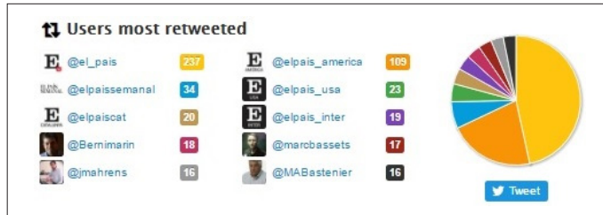
Figura 12. Usuarios más retuiteados por el director de El País , Antonio Caño

a un año, desde julio de 2015, por ser el tiempo que le ha sido necesario para publicar 3.200 tuits.