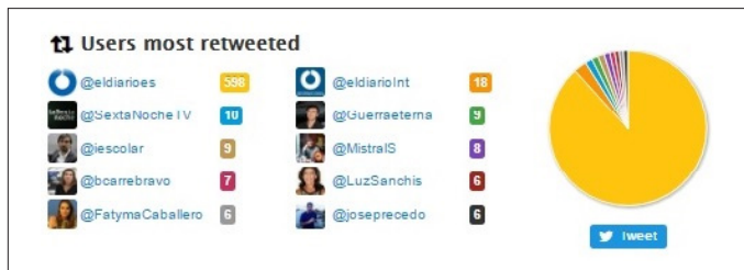
Figura 6. Usuarios más retuiteados por el director de Eldiario.es , Ignacio Escolar

El director del nativo digital Eldiario.es es el segundo más activo en Twitter, detrás de la directora de Público , Ana Pardo de Vera. Además, es el tercer diario digital con más difusión en 2016 según OJD. La actividad del director a través de su perfil es básica para la proyección de los contenidos del medio.