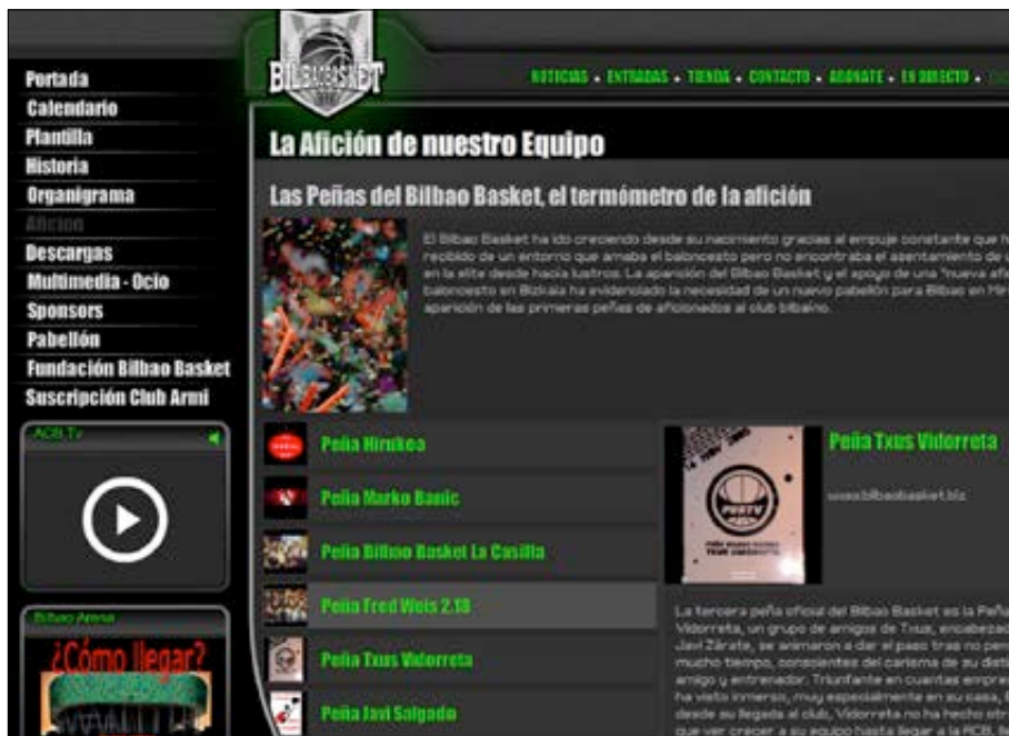
Fig. 5. Ejemplo de información sobre peñas del Bilbao Basket