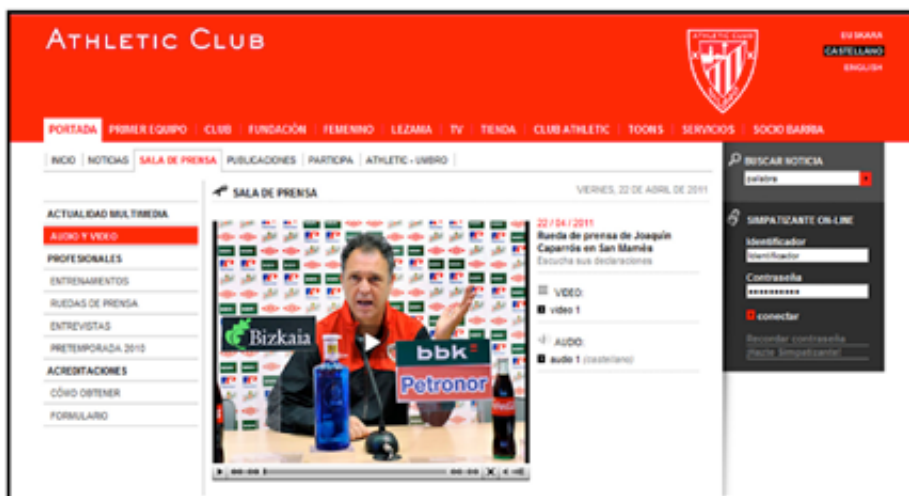
Fig. 3. Sala de prensa de la página Web del Athletic Club de Fútbol

Respecto a la sala de prensa, son muy pocas las páginas que ofrecen esta posibilidad. Se trata de una opción que los periodistas destacan como uno de los elementos más positivos de las nuevas tecnologías (García Orosa, 2009: 43) ya que pueden consultar instantáneamente un sinnúmero de archivos, bases de datos, informes, servicios online. El trabajo de los profesionales de la comunicación puede verse modificado durante los próximos años positivamente siempre y cuando sepan aprovechar las ventajas que los gabinetes de comunicación online ofrecen (García Orosa 2009: 52). Los tres clubes de fútbol analizados, Athletic de Bilbao (fig. 3), Real Sociedad y el Eibar Fútbol Club , ofrecen esta opción en sus sitios Web. En baloncesto solamente el primer equipo, Caja-Laboral Baskonia , la ofrece. Lo mismo ocurre con el ciclismo donde es el club más destacado quien ofrece esta opción. El resto de páginas no contemplan esta posibilidad.