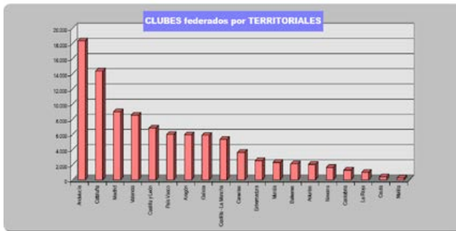
Fig. 2. Número de clubes federados por territorios