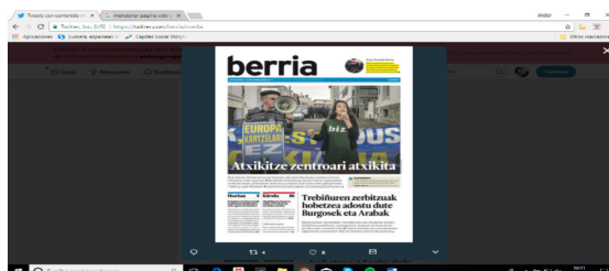
Figura 1: Ikusketa hemerografikoko adibidea.

Berria, Diario Vasco eta El Correoren azaletako gaitegiek osatzen dute azterketako bigarren atala. Portadak @berria, @elcorreo_com eta @diariovasco-ren Twitter kontuetako argitalpenetatik lortu dira. Irudian edozein portada bereganatzeko sistema: