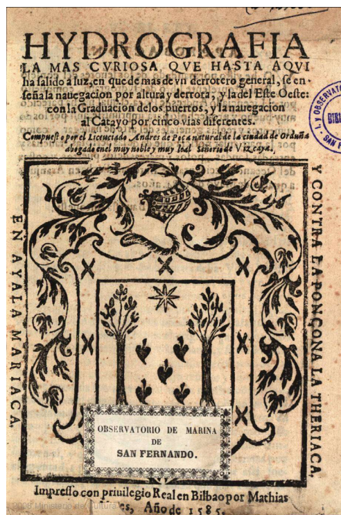
Figura 1. Frontispicio de Hidrografía [...] de Poza (Bilbao, 1585).