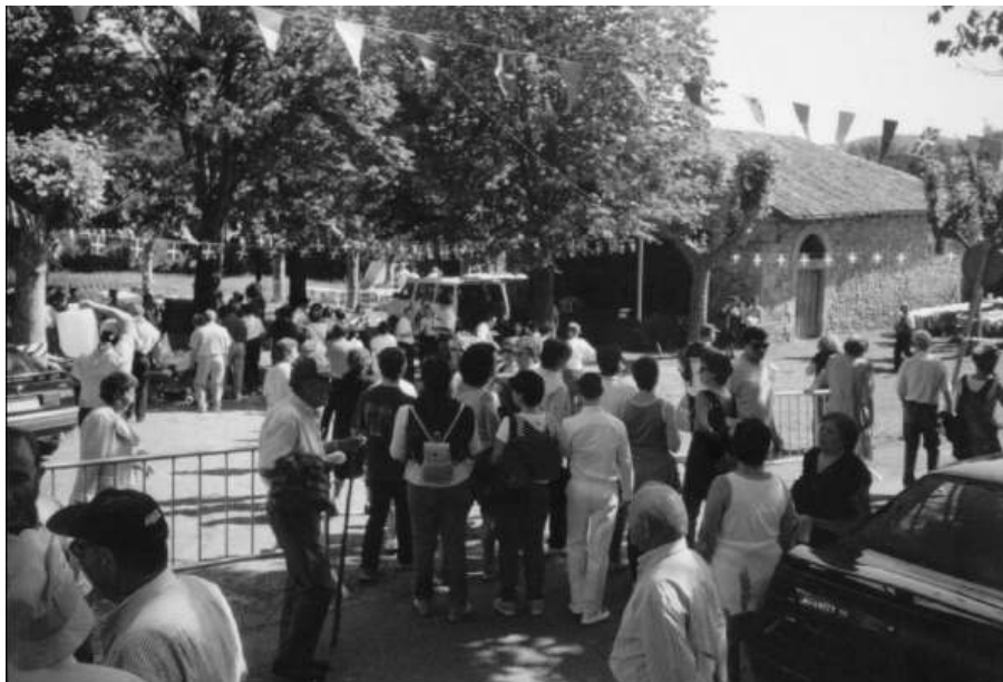
Los actores acercándose a la ermita para asistir a Misa Mayor (2002).