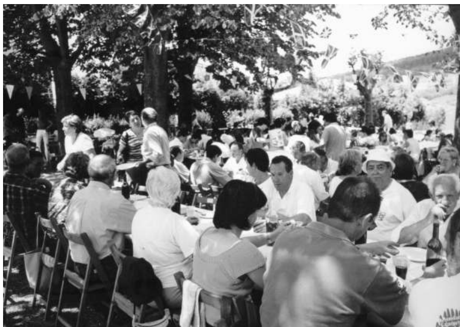
Momento de la comida popular en los alrededores de la ermita (2002).