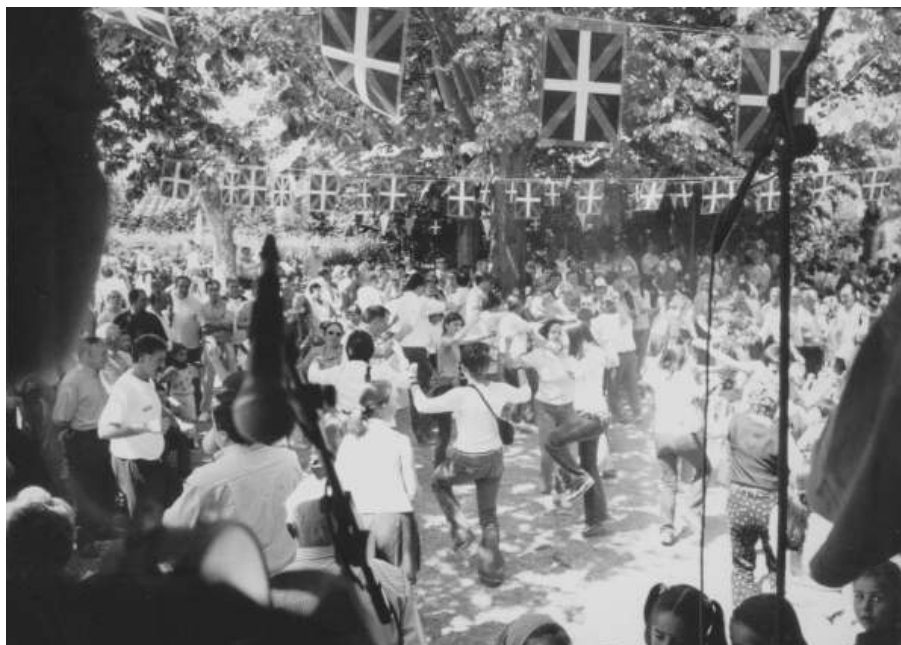
Romería celebrada tras la Misa Mayor (2002).