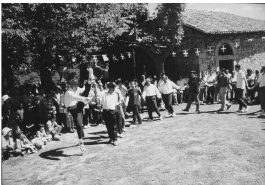
Soka-dantza bailada a la salida de Misa Mayor (2002).