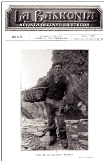
Poseedor del besugo de Navidad. Nº 1258 (20/12/68); tapa.

La lectura que de ellas puede hacerse, permite elaborar un texto enriquecedor que evidencia no solo su calidad profesional, sino su vocación por el trabajo. Cada tanto el fotógrafo aparecía en las imágenes, mostrando un cuer-