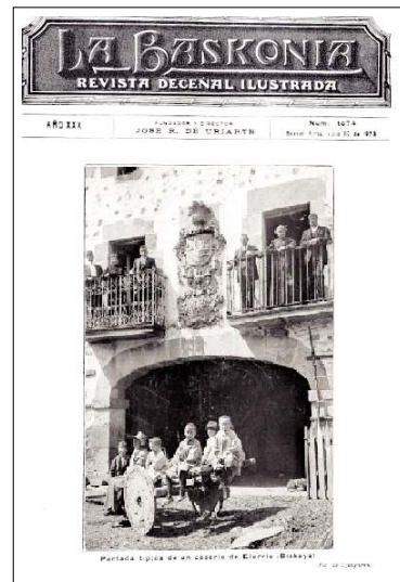
Típica portada de la casa solar de Zubieta, de Apatamonasterio (Biskaya). Nº 1033 (10/6/1922); tapa.