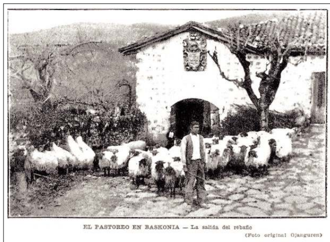
El pastoreo de Baskonia. La salida del rebaño. Nº 1311 (28/2/1930); tapa.

Otras mostraban incipientes idilios o esperas ilusionadas. Las abuelas cuidando los niños, tejiendo o pelando castañas. Los abuelos, de presencia digna y reposada, algunos reunidos jugando al mus, otros charlando en derredor de una mesa, bebiendo un chacolí o contando cuentos a los más pequeños en escenas de carácter bucólico e intimista. Los títulos de las fotografías, eran de por si originales y elocuentes, por ejemplo: "Los primeros frutos", "Mujeres cosechando", "Concurso de ciega" o "El pastoreo en Baskonia. La salida del rebaño" por mencionar algunos.