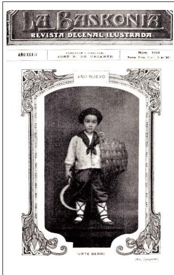
Urte Berri "Año Nuevo". N.º 1198 (10/1/1927); tapa.