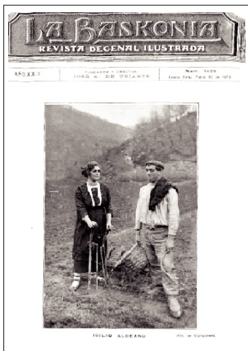
Idilio aldeano. N° 1026 (30/3/1922); tapa.

Las fotografías de tapa que representan esas escenas rurales, muestran en general hombres y mujeres layando la tierra, diversos oficios rurales, otras, jóvenes con un canasto en la mano para recoger los frutos, intercambiando la producción de sus caseríos o en busca de agua en la fuente o portando los cántaros en sus hombros o sobre la cintura o cabeza. Las notas dan cuenta de sus vestimentas, la belleza y gracia vasca, el peinado y calzado femenino. Están presentes en este escenario, las herramientas de labranza, los animales utilizados en el transporte y de cría. A estas particularidades, se sumaban otras escenas demostrativas de los múltiples y variados trabajos de la mujer como la cosecha, las compras, las tareas domésticas, la fabricación del pan o el cuidado de los hijos.