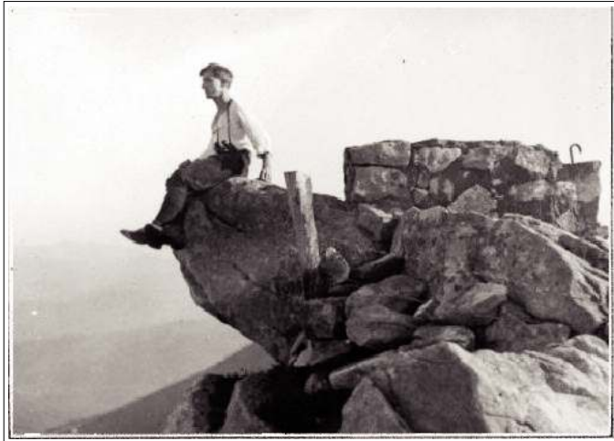
Intrépido alpinista. Nº 1129 (10/2/1925); p. 199.