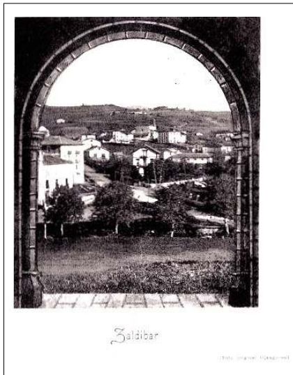
Zaldibar. Nº 1354 (10/5/1931); tapa.

El fotoperiodismo ejercido por Ojanguren, permitió conocer y recrear Euskadi con los elementos técnicos de la época. Para esos años utilizaba como se dijera, una máquina Kodak, recurso utilizado con verdadero arte. Las imágenes documentales, edificios emblemáticos, paisajes y en particular los rostros, destacan por su claridad y valor estético 4 .