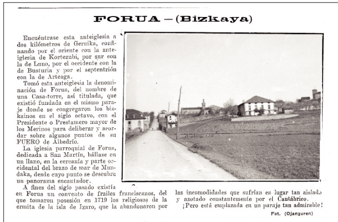
Forua. Nº 1054 (10/1/1923); p. 147.

Otras contenían datos adicionales sobre los animales y aves del lugar y sus movimientos migratorios. Un escrito acerca del monte Ermio lo describe con