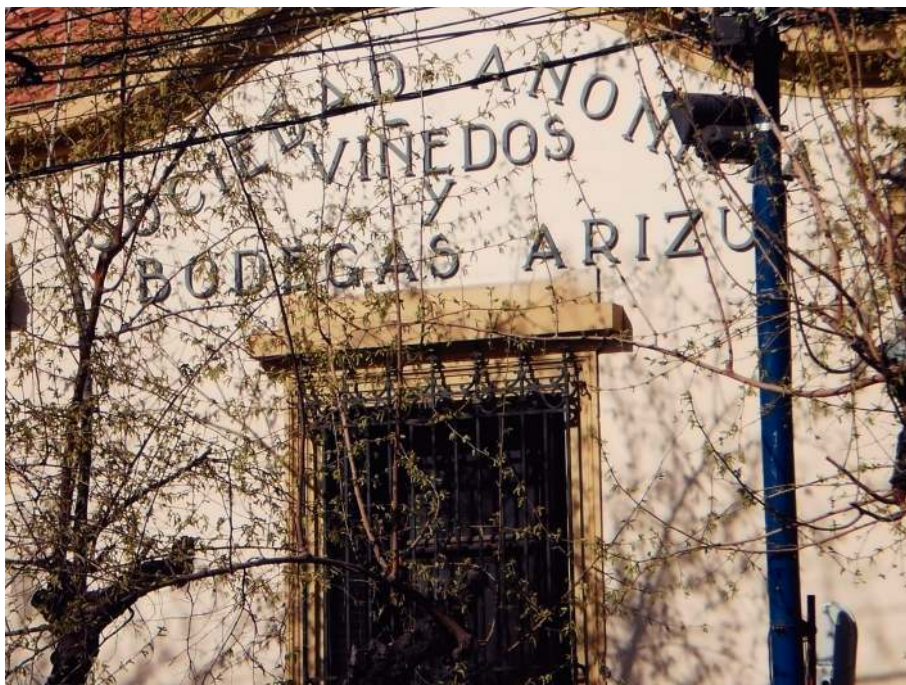
Sociedad Anónima Viñedos y Bodegas Arizu.

cobrando protagonismo Las redes con sus connacionales también les sirvieron para armar su mercado de vino y para estructurar y controlar a los trabajadores en las distintas etapas de la vida empresaria.