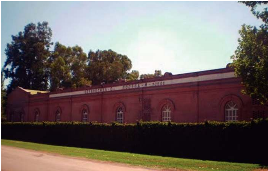
Bodegas Goyenechea S.A. en Villa Atuel, Mendoza.

“La explicación para la expansión hacia el sur mendocino se sustenta en por lo menos dos razones. En primer lugar, el bajo precio relativo de las tierras del sur en comparación con los de la primera zona vitivinícola.... La segunda razón se relaciona con la factibilidad de dotar a los viñedos de agua de riego, posibilidad más difícil de concretar sobre el rio Mendoza dada la