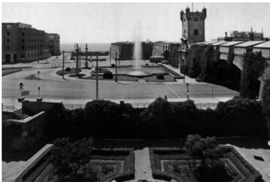
Cádiz. Puerta de Tierra, a la entrada de la ciudad.