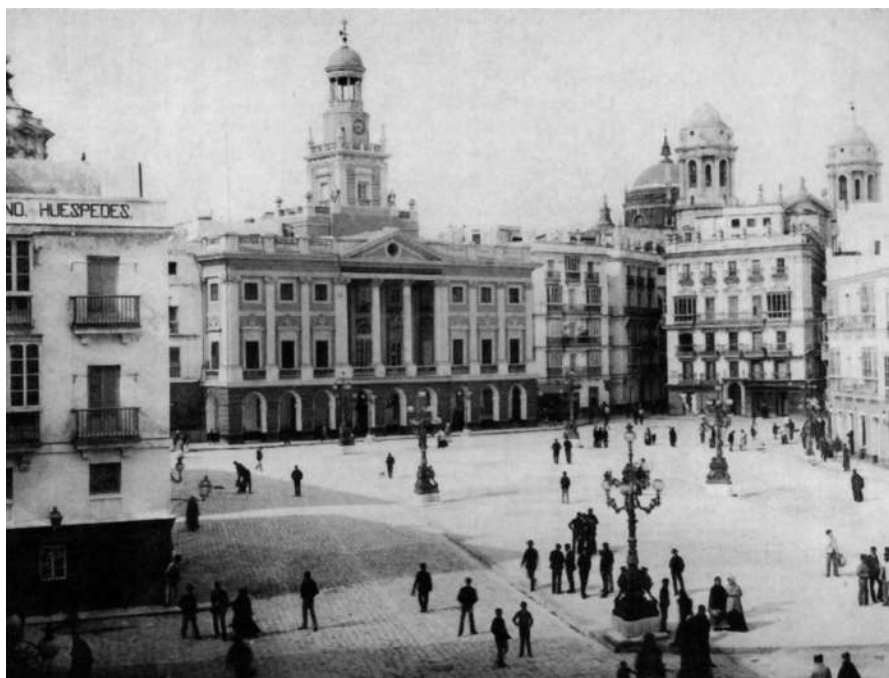
Cádiz. Plaza de Isabel II.

perpetuo que habemos tenido y tenemos de la capilla dicha...» obligandose a pagar las limosnas que el dicho convento ha llevado y percibido.