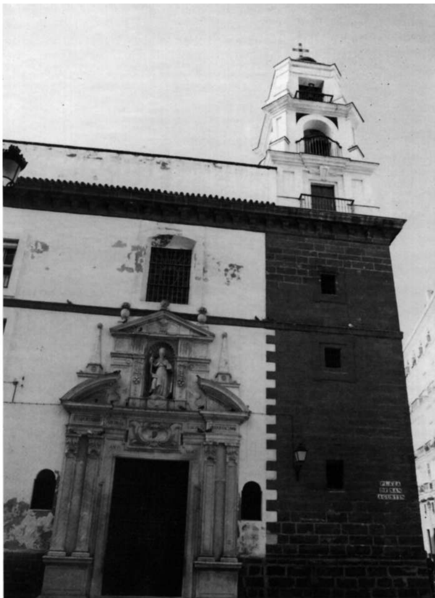
Portada y vista general de la Torre de la iglesia de San Agustín.