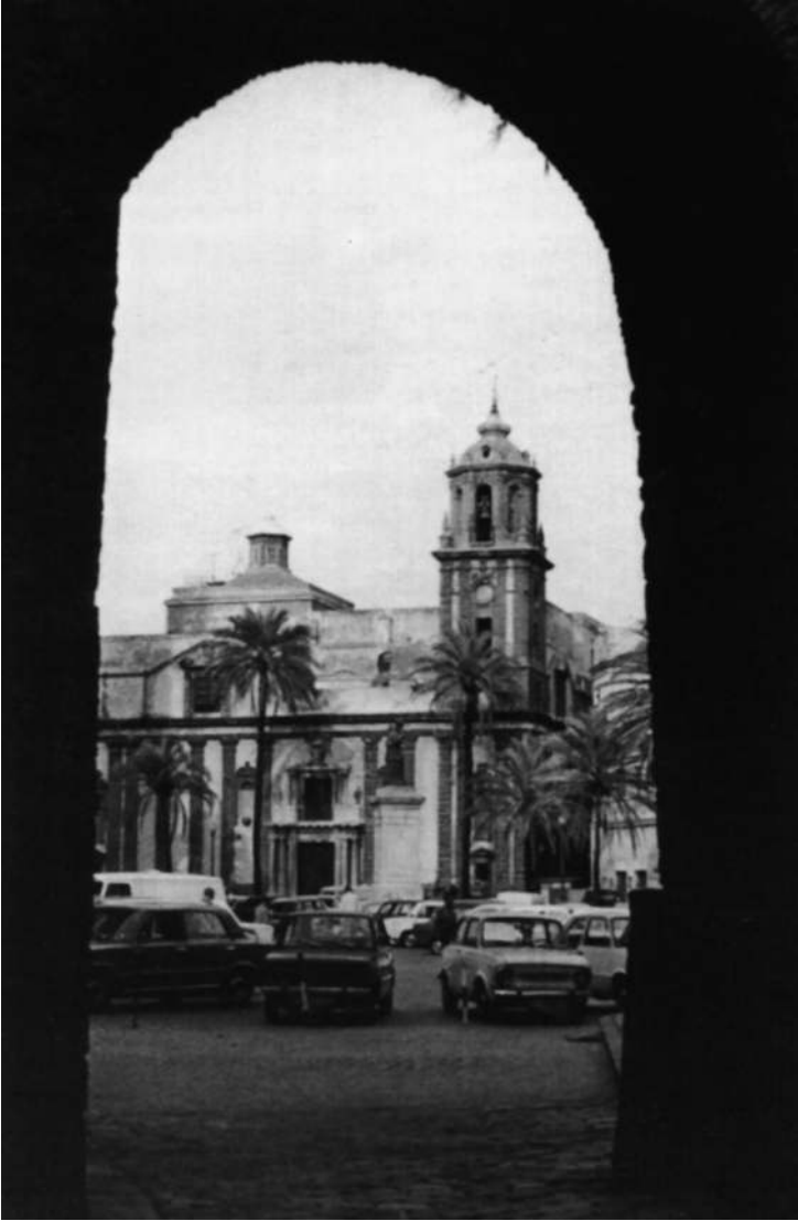
Cádiz. Arco de la Rosa e iglesia de Santiago de los PP. Jesuítas, a la que aparecen vinculados muchos vascos de la Compañía de Caracas.