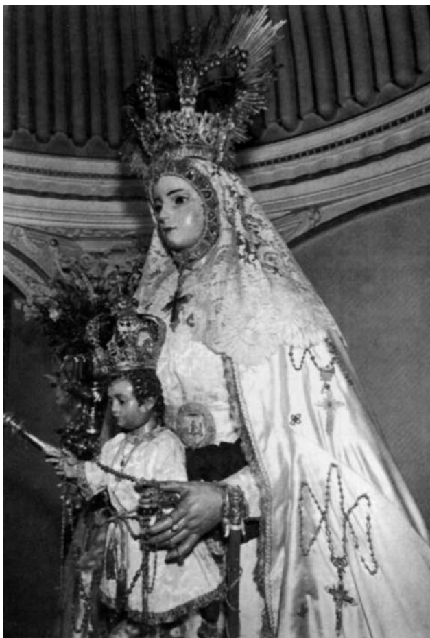
Virgen del Rosario Coronada, Patrona de Cádiz. Convento de los PP. Dominicos al que favorecieron muchos vascos como el alavés Domingo de Munárriz.

Si pensamos en un principio ofrecer un estudio detallado de las aportaciones pías y benéficas de los vascos en Cádiz, la excesiva acumulación de fechas y datos nos han obligado a estas afirmaciones que tienen toda sus base en los documentos. Porque no convenía olvidar y sí destacar este costado generoso de los vascos en Cádiz, uno de los que más nos dejan entrever el carácter honrado y altruista de los mismos.