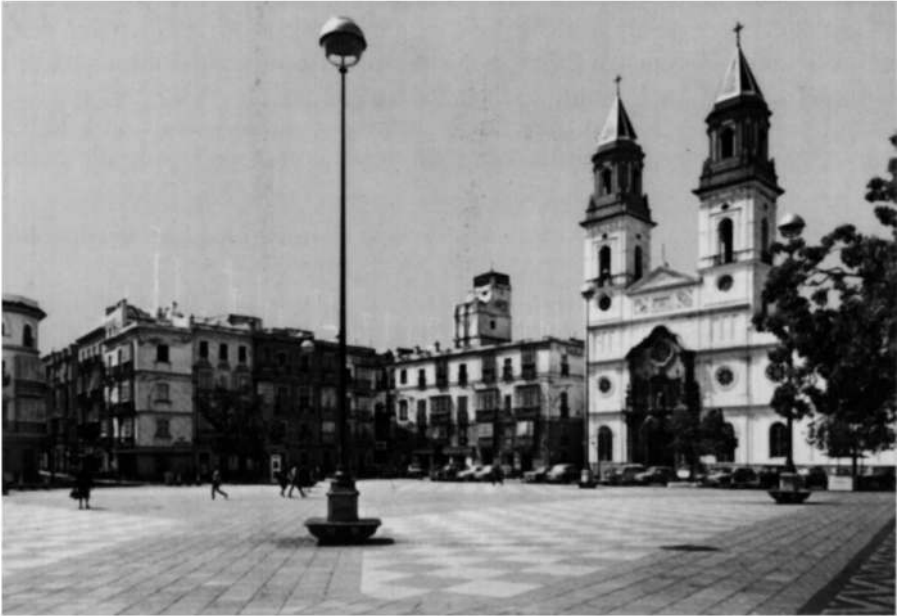
Cádiz Plaza e iglesia de San Antonio donde tenían sus casas los Martín de Murguía, Ruiz de Apodaca, etc.