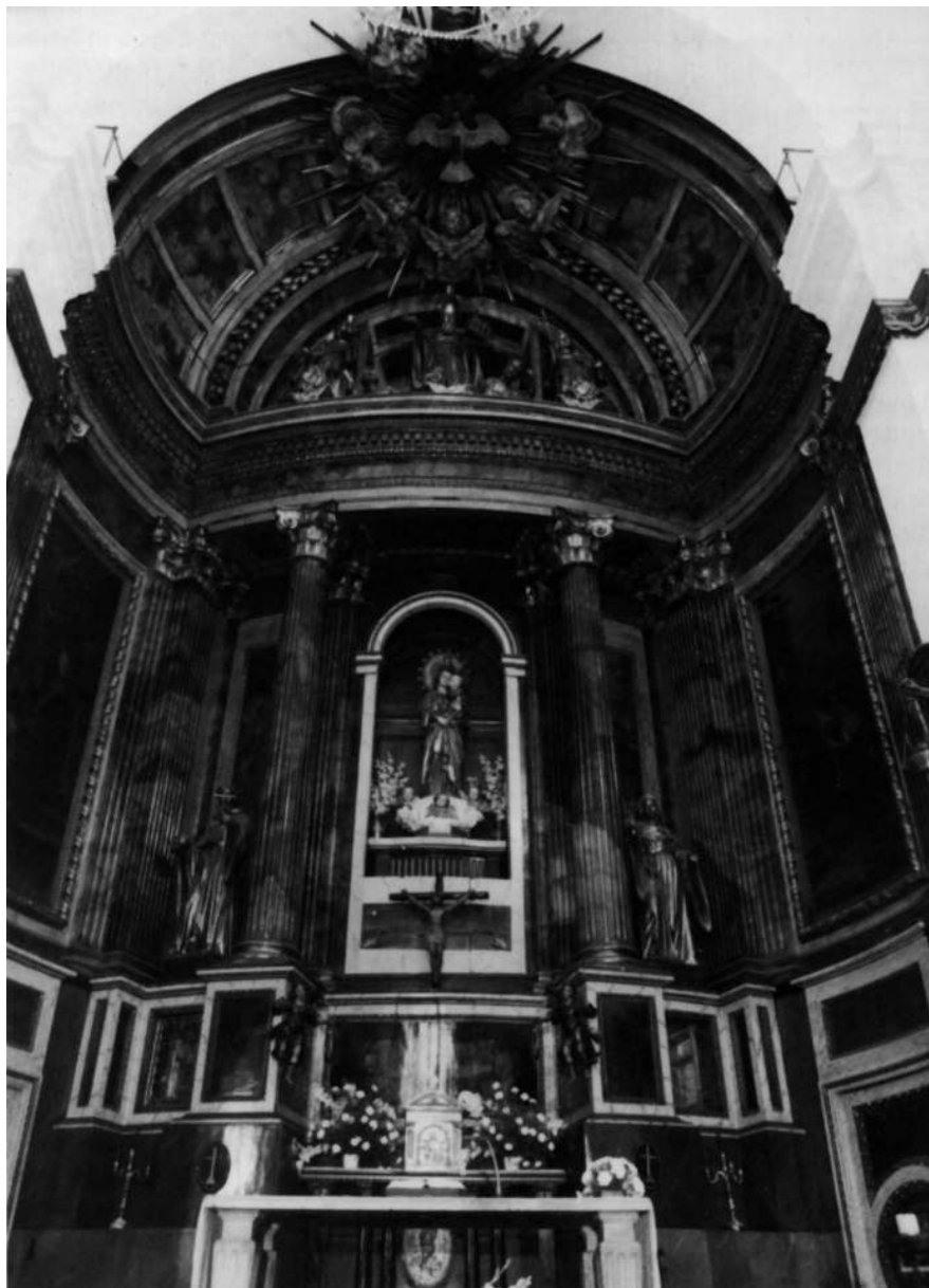
Retablo Mayor de la iglesia de San Agustín. Obra del arquitecto Pedro de Albu, de Zumárraga.