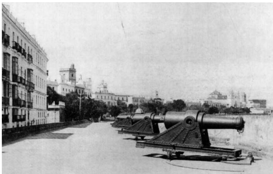
Cádiz. Vista desde San Carlos.