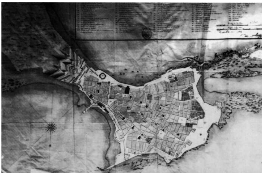
Mapa de Cádiz. Año 1772.

Tanto en Sevilla como en Cádiz en la lista de cargadores de Indias es densa la presencia de vascos. Sabemos también que desde un principio existió una política proteccionista para el hierro vizcaíno y así lo determinaba la ley nº 51, tit. 26 del libro III de la Recopilación de las Leyes de Indias al disponer «que no se dejase pasara ellas fierro si no es de Vizcaya» (Recopilación de las Leyes de los Reinos de Indias. Ed. 1681) Solamente en algunos documentos hemos leído cargas de exportación de hierro a América, como en el navío Santa Cruz , de Diego de Iparaguirre. Pero que duda cabe que con este material y otros géneros con los que comerciaban los vascos fueron haciendo sus fortunas.