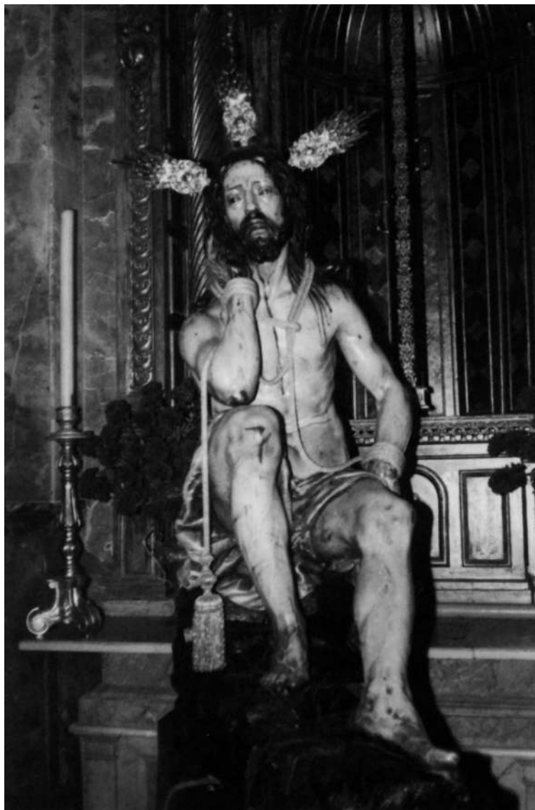
Imagen titular de la Cofradía Vasca de Cádiz. Obra de Jacinto Pimentel. 1638. En la iglesia de San Agustín.