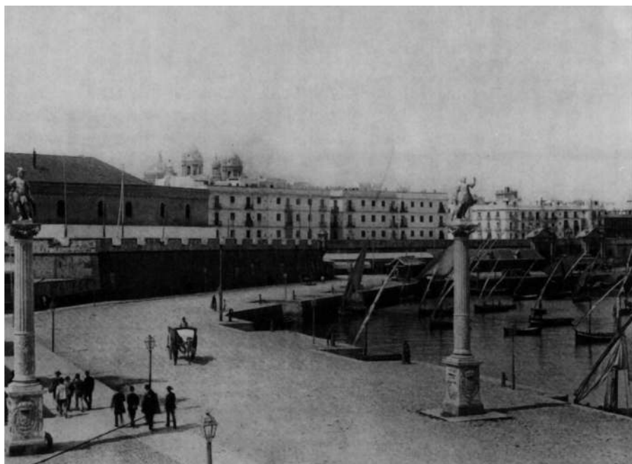
Cádiz. La Entrada.