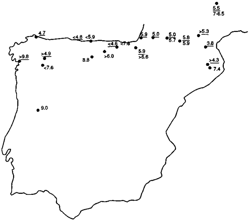
Fig.5: Dataciones de radiocarbono correspondientes a la expansión de Alnus en el norte de la península Ibérica. Los números subrayados indican la expansión del taxon; los demás corresponden a la primera aparición de polen de Alnus en cada diagrama.

En el piso montano de la Cordillera Cantábrica, el Pirineo y el Sistema Ibérico, Quercus y Pinus sylvestris co-dominan probablemente el paisaje. El avellano ( Corylus ) invade progresivamente este dominio. En el Pirineo oriental comienza a propagarse un núcleo de Abies (abeto).