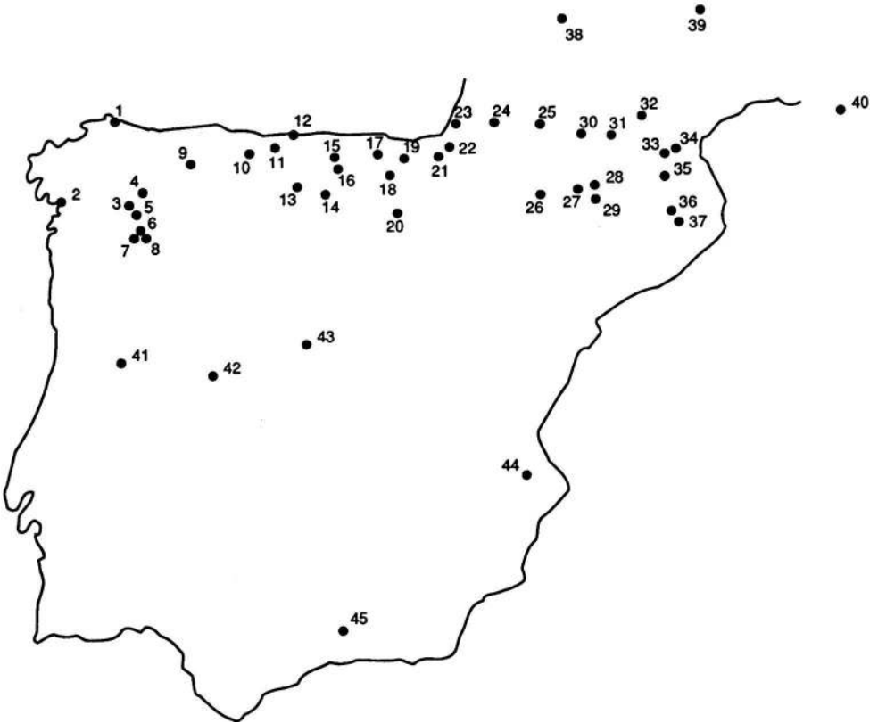
Fig. 1 : Localización geográfica de los yacimientos polínicos seleccionados para este trabajo. 1 -Montes del Buyo, 2-Mougás, 3-Piedrahita, 4-Brins, 5-Sierra de Queija, 6-Laguna Cárdenas, 7-Sanabria, Laguna de las Sanguijuelas, 8-Laguna Arroyas, 9-Lago de Ajo, 10-Llano Ronanzas, 11-Buelna, 12-Jerra, 13-Puertos de Riofrío, 14-Valle de la Nava, 15-Pico del Sertal, 16-Cueto de la Avellanosa, 17-Los Tornos, 18-Lago de Arreo, 19-Saldropo, 20-Quintanar de la Sierra, 21-Belate, 22-Atxuri, 23-Le Moura, 24-L'Estarès, 25-Biscaye, 26-Formigal de Tena, 27-Baños de tredos, 28-La Paul de Bubal, 29-Llauseu, 30-Barbazan, 31-Freychinède, 32-Pinet, 33-Les Mouillères, 34-La Moulinasse, 35-La Borde, 36-Pla del Estany, 37-Les Palanques, 38-Beune Valley, 39-Massif Central, 40-Provence, 41-Lagoa Comprida, 42-Los Conventos, 43-Peñalara, 44-Ereta del Pedregal, 45-Padul.

Para algunos táxones se adjuntan mapas de repartición geográfica con las fechas de expansión que permiten una mejor visualización regional. La expansión corresponde en términos polínicos al establecimiento de una curva continua (Bennett 1990). Las fechas vienen expresadas en miles de años antes del presente (kiloaños BP).