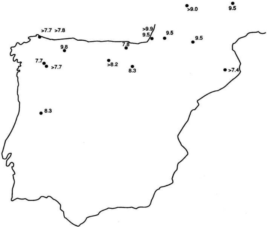
Fig.4 : Dataciones de radiocarbono correspondientes a la expansión de Corylus en el norte de la península Ibérica.

Su expansión, sin embargo, es más tardía (fig. 5). Una primera pulsación puede datarse alrededor de 8.0-7.0 ka BP y la gran progresión del género a distintas fechas según regiones, mayormente entre 6.0 y 4.5 ka BP.